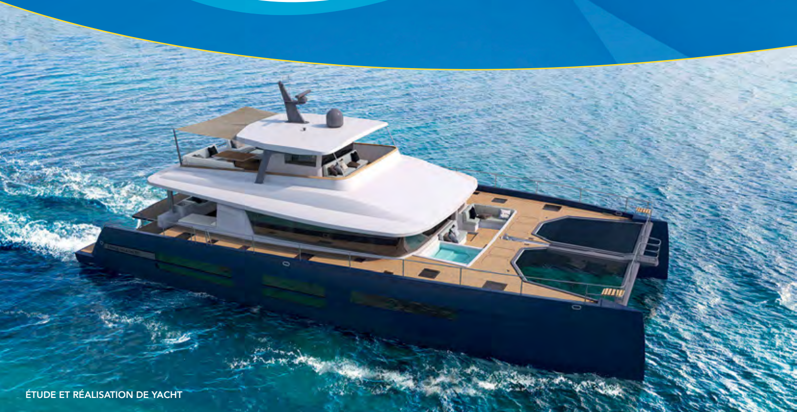
ÉTUDE ET RÉALISATION DE YACHT