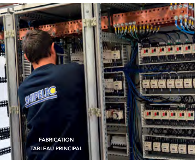
FABRICATION TABLEAU PRINCIPAL