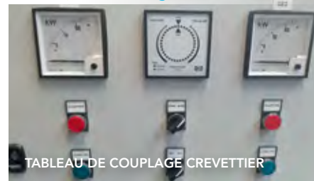
TABLEAU DE COUPLAGE CREVETTIER

SHIPELEC a une compétence reconnue sur différents types de navire :