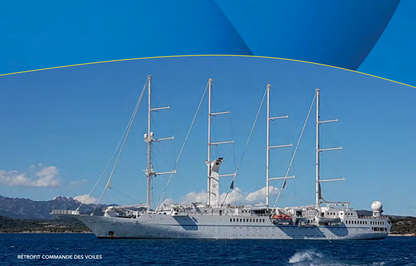
RÉTROFIT COMMANDE DES VOILES