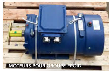
MOTEURS POUR GROUPE FROID