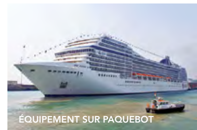
ÉQUIPEMENT SUR PAQUEBOT