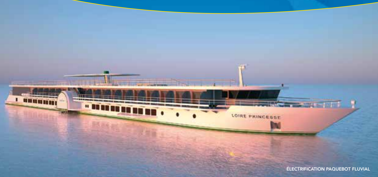
ÉLECTRIFICATION PAQUEBOT FLUVIAL