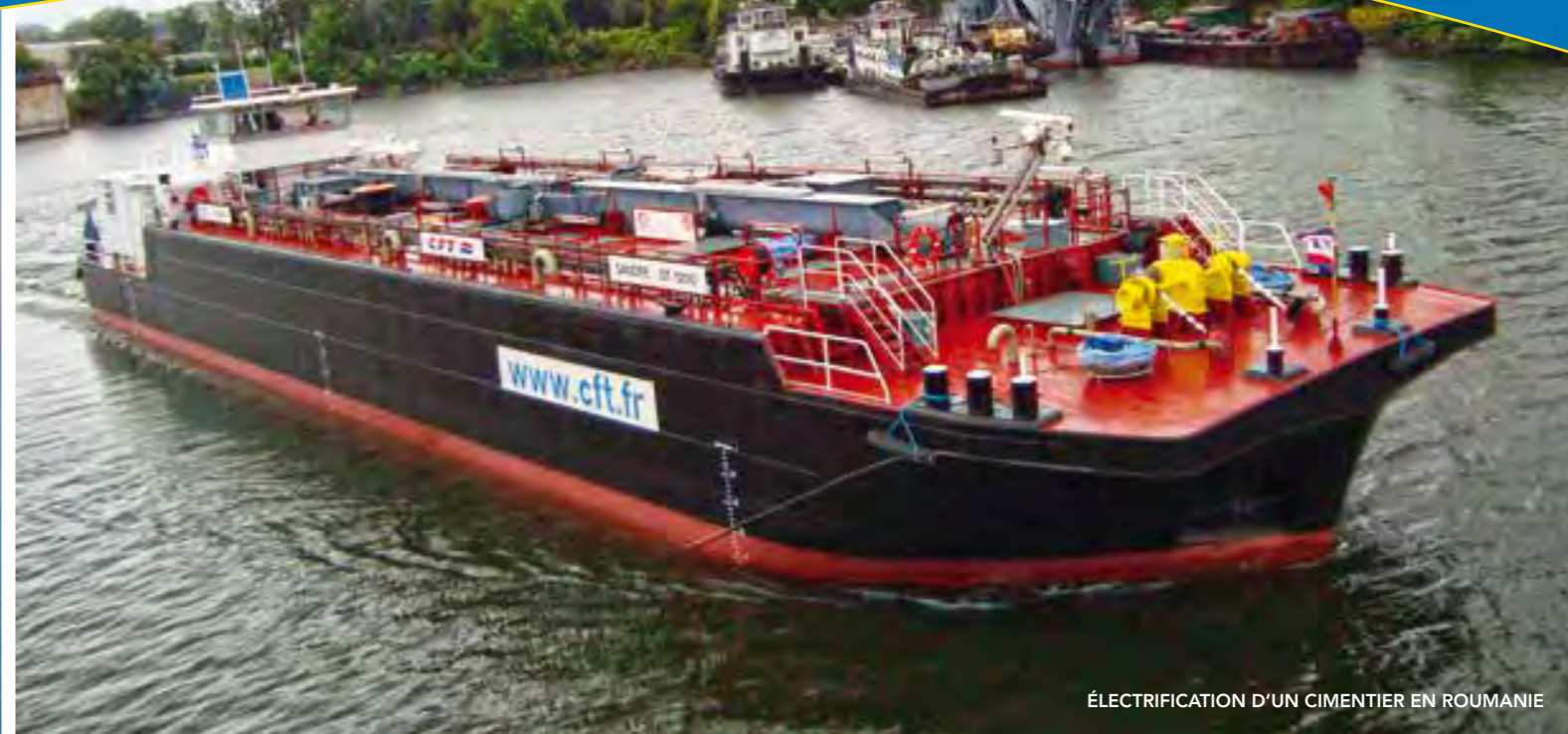
ÉLECTRIFICATION D'UN CIMENTIER EN ROUMANIE