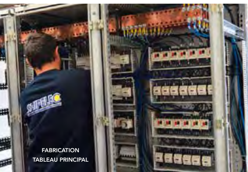
FABRICATION TABLEAU PRINCIPAL