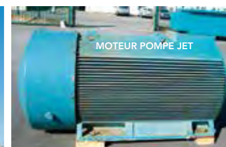
MOTEUR POMPE JET