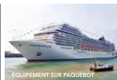
ÉQUIPEMENT SUR PAQUEBOT